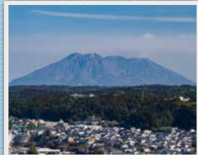
67 城山公園 (一宇治城跡)