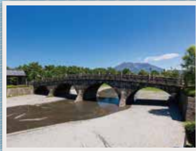
27 石橋記念公園・祇園之洲公園