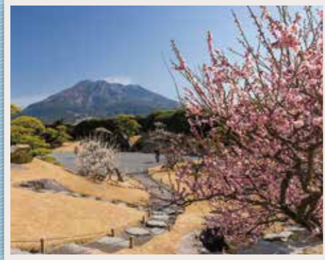
30 名勝 仙巖園