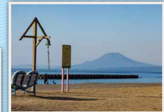
76 神川海岸 (神川キャンプ場)